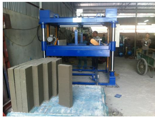
96 viên gạch cỡ 7.5x 20 x60cm được cắt rất đẹp