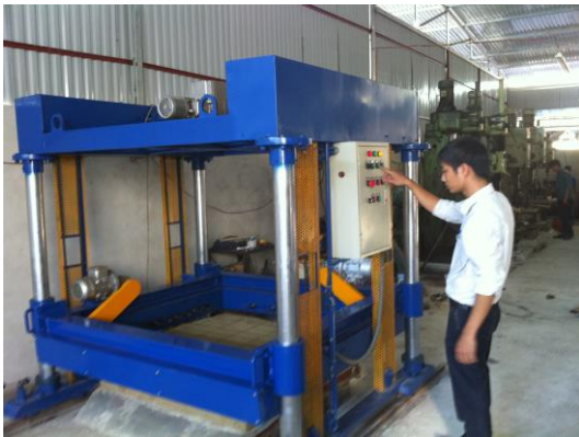
Máy cắt cố định đang hoạt động