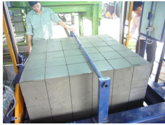
Gạch 20x 20 x 60cm được cắt chính xác