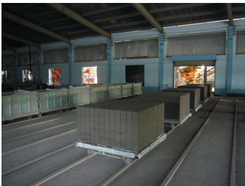
Đế khuôn di động và gạch sau cắt